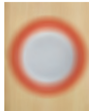
Weißer Teller mit rotem Rand